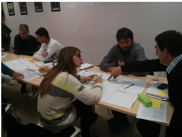
Imatge 1. Moment de treball en grups per dissenyar actuacions per posar en pràctica els principis fonamentals de la Carta del Paisatge.