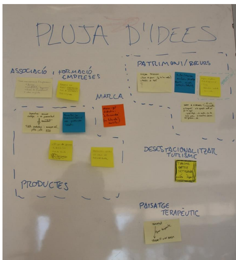
Imatge 2. Pluja d'idees de noves actuacions per incorporar en el programa de la Carta.